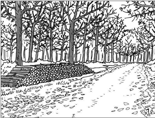
Une forêt d'arbres à feuilles caduques

a Devant chaque paragraphe, écris le numéro de la forêt correspondante.