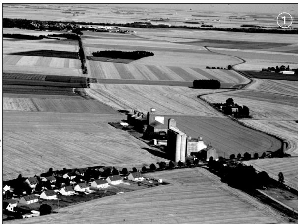
1. Dans le Bassin parisien

Observe les documents puis complète le tableau.