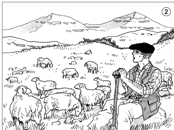
2. Dans les Pyrénées